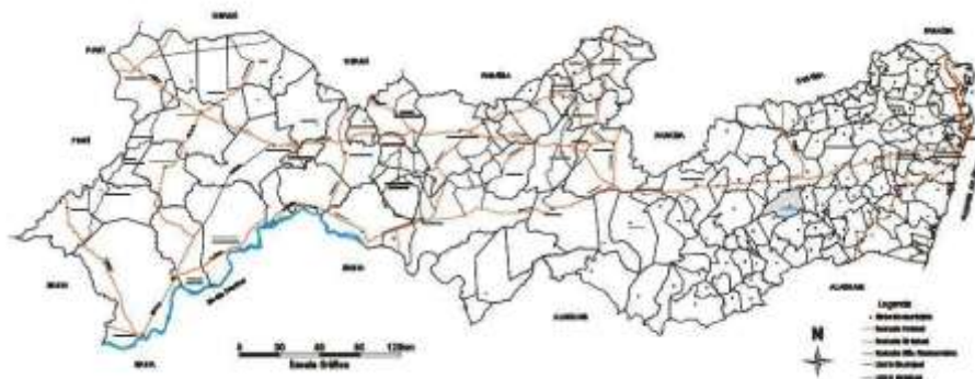
Figura 1 - Mapa de acesso rodoviário

A sede do município tem uma altitude aproximada de 454 metros e coordenadas geográficas de 08 Graus 29 min. 23 seg de latitude sul e 36 Graus 03 min 34 seg de longitude oeste, distando 163,1 km da capital, cujo acesso feito pela BR-232/104 e PE-149.